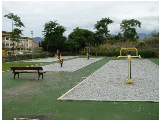
Parque El Litoral. Máquinas de musculación al aire libre

NOTA: Para más información sobre el uso correcto de los aparatos de musculación, se recomienda consultar la publicación “Zonas de musculación aire libre” , en nuestra página Web