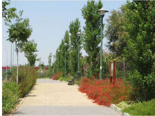
Avenida López de Peñalver