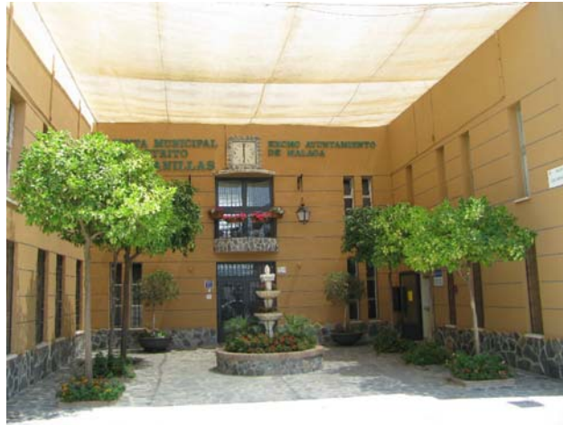
Junta Municipal Distrito Campanillas