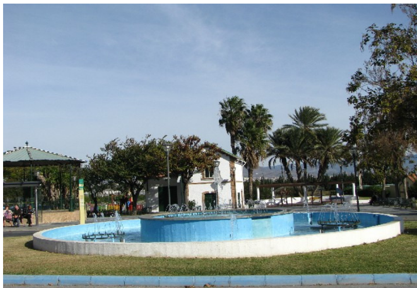
Plaza de la Inmaculada

RECORRIDO: Se inicia en la Plaza de la Inmaculada (junto a la Junta municipal de distrito)