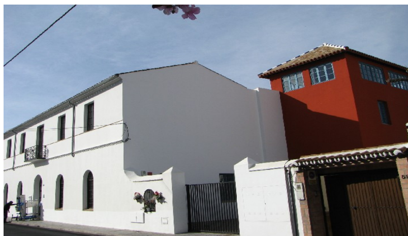
Casa Museo Gerald Brenan

VUELTA: desde la zona de musculación al aire libre, salir a la carretera de Coín y seguir por lateral izquierdo en dirección a Alhaurín de la Torre. En la rotonda de Churriana, cruzar por el semáforo, continuar por C/ Torremolinos, C/Teresa Blasco, Camino Nuevo y terminar en Plaza de la Inmaculada.