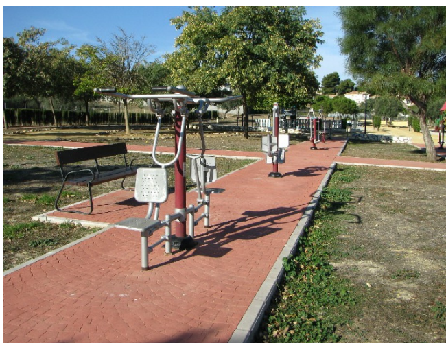
Parque y zona musculación Monsálvez

VUELTA: desde la zona de musculación al aire libre, salir a la carretera de Coín y seguir por lateral izquierdo en dirección a Alhaurín de la Torre. En la rotonda de Churriana, cruzar por el semáforo, continuar por C/ Torremolinos, C/Teresa Blasco, Camino Nuevo y terminar en Plaza de la Inmaculada.