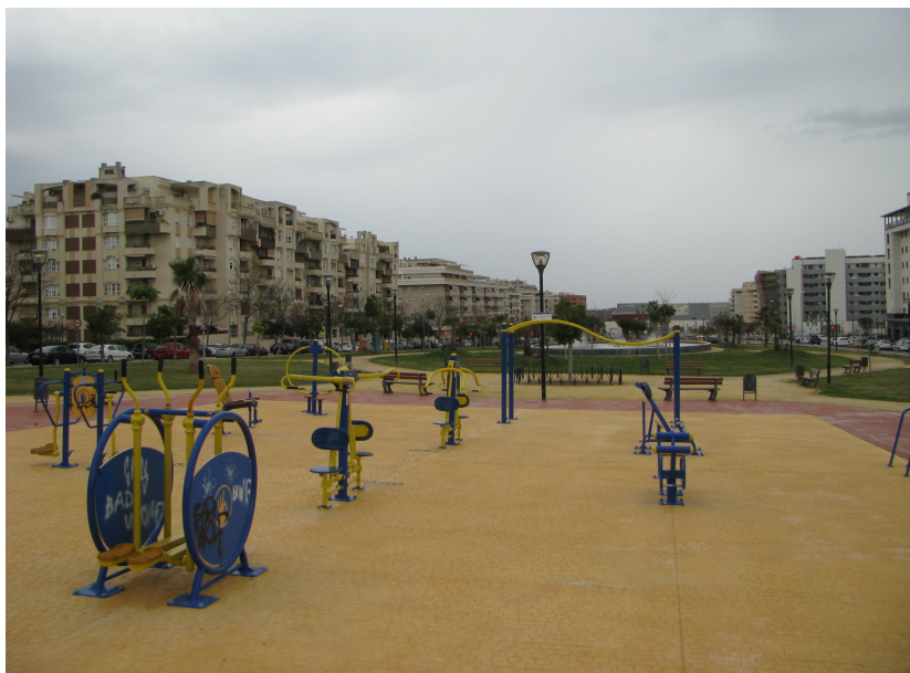
Parque Virgen de Araceli

FINAL DEL RECORRIDO: Parque Virgen de Araceli (junto a zona de musculación)