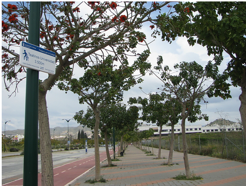
Avenida Escritor Antonio Soler junto al carril bici.

RECORRIDO: Se inicia en Avda. Escritor Antonio Soler (junto al carril bici), Avda. María Victoria Atencia, Avda. Escritor Ángel Caffarena, C/Juan Francés Bosca (junto a zona de musculación), C/ Orson Wells (junto a jardines edificio Altos de Teatino), Carril del Capitán.