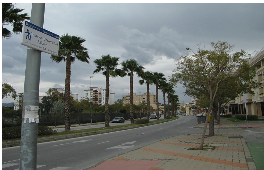
Avenida María Victoria Atencia